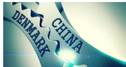
Det danske udenrigsministeriums hjemmeside – læs mere her om det strategiske partnerskab: https://kina.um.dk/en/about-denmark

Vi har opnået frugtbare resultater i samarbejdet inden for miljø, energi og klima. Vi har opbygget langsigtede og troværdige grønne partnerskaber og ydet væsentlige bidrag til den globale bekæmpelse af klimaforandringer og den grønne omstilling.